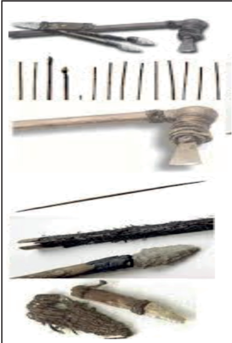
Buz Adam Ötzi'ye ait bazı eşyaların görseli

Günümüzden 20 yıl önce Avusturya-İtalya sınırında Alp Dağlarında yürüyüşe çıkan iki Alman turist, son zirveye de çıktıktan sonra daha kestirme bir yerden dönmek istemişlerdir. Buz halindeki bir dere yatağının erimekte olan kısmında siyah bir leke gözlerine takılmış ve daha dikkatli baktıklarında ise bunun bir ceset olduğunu fark edip polise haber vermişlerdir. Ceset biraz araştırıldıktan sonra önemi hemen anlaşılmıştır. Yapılan araştırmalar sonucunda ceset MÖ 3300'lere tarihlenmiştir. Son yapılan araştırmalara göre öldüğünde 45 yaşlarındaydı, 50 kiloydu ve 165 cm boyundaydı. 1991 yılında bulunduğu anda ise küçülerek mumyalaşmasından dolayı 13 kiloydu. Ölürken üzerinde birkaç farklı hayvan derilerinden yapılmış kıyafetleri ve yine çeşitli otlardan yapılmış pelerini vardı. Ayı kürkünden yapılmış şapkası ise kafasındaydı. Ayaklarında ise yine hayvan derisinden yapılmış, kötü hava koşullarına uygun, su geçirmez ayakkabıları vardı. Ayakkabılarının dış tabanı ayı derisinden iç tabanı ise geyik derisinden yapılmış olup arası ağaç kabuklarıyla doldurulmuştu ve ayakkabının içi kuru otlarla bezenmişti. Yapılan araştırmalar Ötzi'nin genellikle etle beslendiği sonucunu ortaya koydu. Dış minelerindeki zedelenmelerden yola çıkılarak varılan bu sonuç, ölmenden hemen önce dağ keçisi ve geyik eti yediğinin ortaya çıkmasıyla da güçlendi. Cesedin yakınlarında ise Ötzi'ye ait yan taraftaki görselde yer alan eşyalara rastlanmıştır.