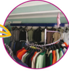
Hazır giyim mağazası

İnsanların yaşamlarını devam ettirmek için, yaptıkları işlerin tamamına ekonomik faaliyet adı verilmektedir. Tarım insanların geçimini topraktan sağladığı bir ekonomik faaliyettir. Pamuk Türkiye’de her bölgede yetiştirilemeyen bir tarım ürünüdür.