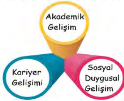
Şekil 1: Gelişim Alanları

Okul rehberlik ve psikolojik danışma programının merkezinde öğrencilerin akademik, kariyer ve sosyal-duygusal gelişim alanında gelişim ihtiyaçlarını ele almak ve bütünsel gelişimlerini kolaylaştırmak ile güçlü yönlerini değerlendirmek ve geliştirmek vardır. Aşağıda üç temel gelişim alanına ilişkin bilgiler verilmiştir: