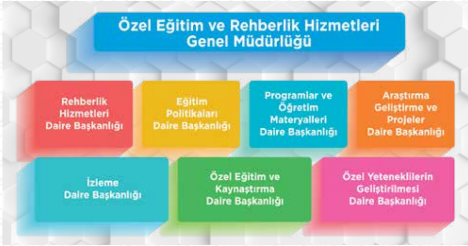
Şekil 1: Özel Eğitim ve Rehberlik Hizmetleri Genel Müdürlüğü Teşkilat Şeması