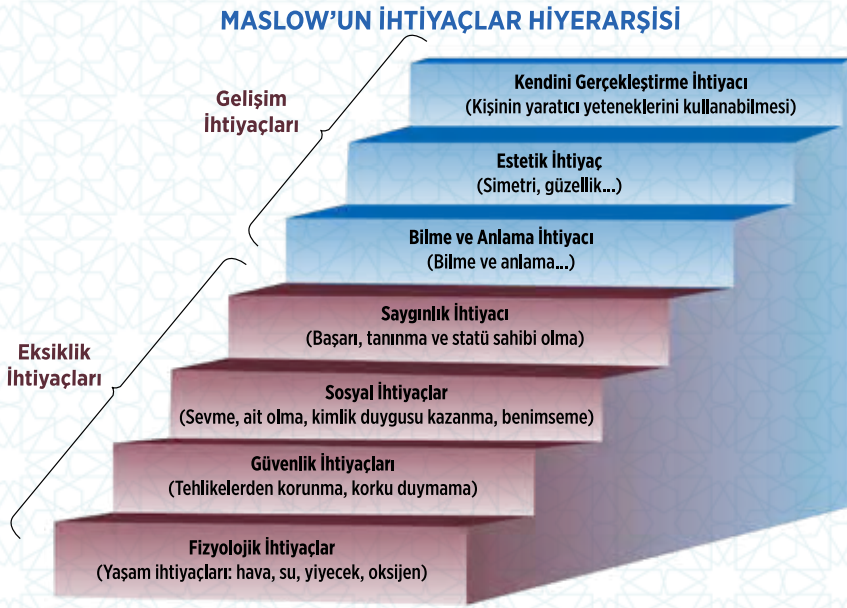
Şekil 5: Maslow'un İhtiyaçlar Hiyerarşisi

Motivasyon kuramlarından biri A. Maslow’a aittir. Maslow (1954) şekil 5’de gösterilen ihtiyaçlar hiyerarşisini önermiştir.