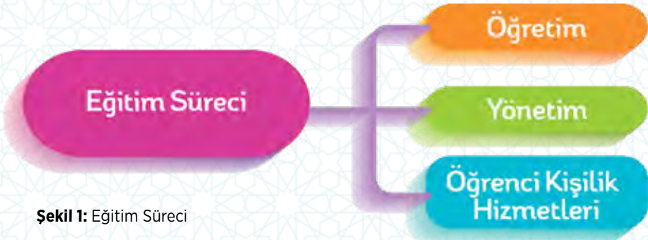
Şekil 1: Eğitim Süreci

Rehberlik hizmetleri ile eğitim arasındaki ilişki, eğitim sürecini oluşturan üç boyut bakımından daha belirgin olarak ortaya konabilir. Eğitim sürecinde üç ana alan, sürecin bütünlüğünü