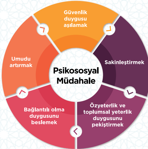
Şekil 4: Psikososyal müdahale ilkeleri [34] .

Yukarıda verilen müdahale ilkeleri dikkate alındığında psikososyal destek kapsamında hazırlanacak olan programlarda bireyler, aileler ve toplum için aşağıda verilen üç alana odaklanılır [28] :