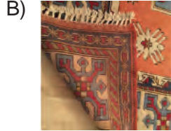
Türk motifleriyle süslü el dokuması halı