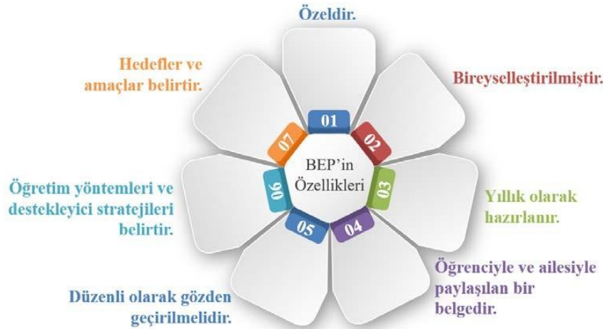
Şekil 2. BEP'in Özellikleri

Özel eğitim ihtiyacı olan her öğrenci için yerleştirildikleri eğitim ortamında bireyselleştirilmiş eğitim programı (BEP) oluşturulması yasal bir zorunluluktur.