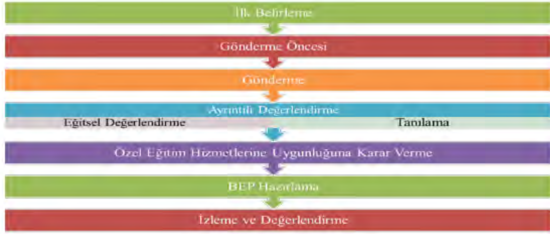
Şekil 1. Değerlendirme Süreci