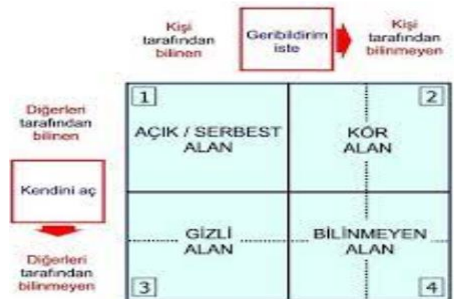
Şekil 2. Johari Penceresi'nin alanları

Diğer taraftan; Amerikalı ünlü iletişimci Dale Carnegie'nin "Söyleyeceğiniz sözünüzü yazmak, sizi düşünmeye ve düşüncelerinizi tasfiyeye sevk eder." sözünde vurgulandığı üzere soyut ve özel düşüncelerin, sözlerin ötesine geçip yazı ile ifadesi, düşüncelerin tasfiyesine neden olmakta ve sadece düşünceleri değil art alanda bulunan çok özel fikirleri ve inançları da karşıdakine aktarmaktadır. Sözlü iletişimde sıklıkla dile getirilen "Ben bunu kastetmedim." veya "Aslında sen yanlış anlamışsın." gibi iletişim kazaları yazılı iletişimde çok az meydana gelmektedir. Bunun nedeni yazarına geniş bir zaman ve düşünme fırsatı sunması ve büyük bir sorumluluk gerektirmesidir. "Söz uçar yazı kalır." atasözünde yazıya atfedilen anlamın önemi de bu gerçek üzerine kuruludur.