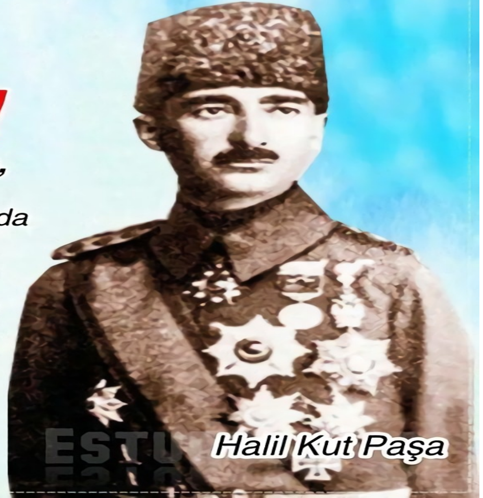
Halil Kut Paşa