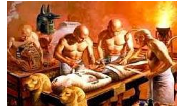
Eski Mısır'da Mumya

SORU 5: (ÇIKTI: TAR.9.2.4.): Saymalıtış: Tanrı Dağları'nda 3600 rakımda taşta kazınmış yaklaşık 100 bin heykel ve bunların birçoğu tanrıya kurban sunmayı anlatıyor. Bu bilgilere göre Türklerde inanç-sanat ilişkisini açıklayınız. (10 puan)