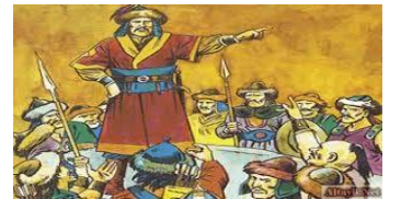
Türklerde Devlet Yönetimi

SORU 5: (ÇIKTI: TAR.9.3.2.): Yandaki yazılı görselden de hareketle Medine Sözleşmesinin yazılı anayasanın ilk örneği kabul edilmesinin sebepleri nelerdir. Yazınız. (10 puan)