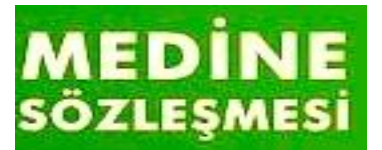
Devlet ve toplum hayatını düzenleyen yazılı anayasanın ilk örneği kabul edilir ve Hz. Muhammed(sav) Döneminde hazırlanmıştır.