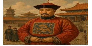
Gücüne güç kattığına inandığı için kendisini Göğün Oğlu olarak gören Çin

SORU 3: (ÇIKTI: TAR.9.3.2.): Yandaki yazılı görselden de hareketle Maniheizm'i benimsemenin Uygurlara etkilerini yazınız. (10 puan)