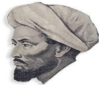
Muallimi Sani olarak bilinir. Eseri Tailüs Saade