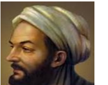
Modern tıbbın öncülerindendir. Eseri El Kanun Fit Tıp