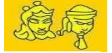
Uygurlarda Böğü Kağan hayvansal gıda tüketimini yasaklayan Maniheizm dinini benimsemiştir.

SORU 4: (ÇIKTI: TAR.9.3.2.): Orta Çağ'da Türk devletlerinde, devlet yönetimiyle ilgili aşağıdaki kavramları açıklayınız. (10 puan)