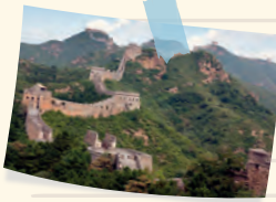
The Great Wall of China

A super long wall in China that was built a really long time ago to protect against enemies. I spent five hours to see it. It's the most amazing place I have ever seen.