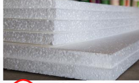
2) Strafor köpük