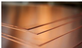
7) Bakır levha