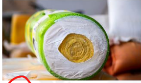
1) Cam yünü

3) Alara evine ses yalıtımı yaptırmak istemektedir. Bu durum için nalburdan malzeme almaya gider. Nalborda çalışan personel, Alara'ya aşağıda verilen malzemeleri gösterir.