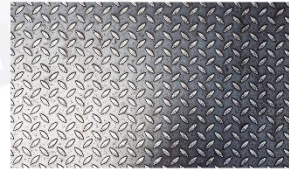
6) Demir levha